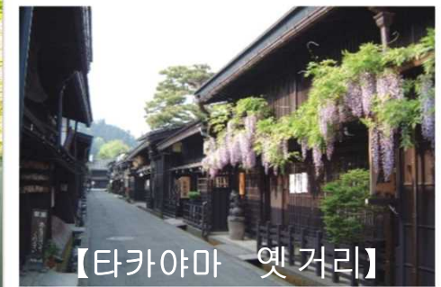
【타카야마 옛 거리】