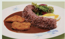
Curry du barrage