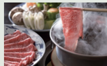
Plat à base de bœuf d'Omi