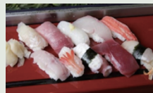
Sushi de la baie de Toyama