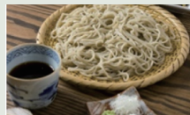
Mì soba Shinshu