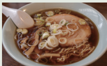
Mì ramen Takayama